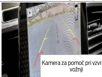
Kamera za pomoč pri vzvratni vožnji

Opomba: Ni na voljo z naročilom opreme Halogenskih projektorskih žarometov z LED dnevnimi lučmi (EOC 587).