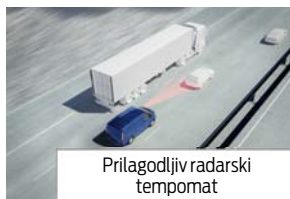
Prilagodljiv radarski tempomat

Na voljo samo v kombinaciji s Prilagodljivim radarskim tempomatom in Navigacijskim sistemom SYNC.