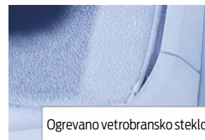
Ogrevano vetrobransko steklo