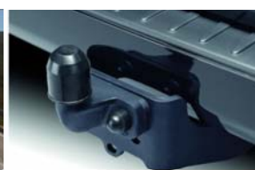
Vlečna kljuka (s programom za stabilizacijo priklopnika TSC)