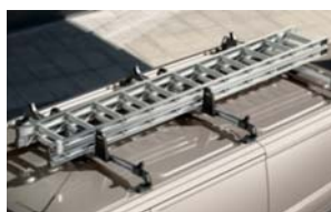
Integrirani poklopni strešni nosilci