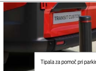
Tipala za pomoč pri parkiranju