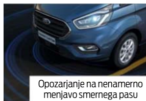
Opozarjanje na nenamerno menjavo smernega pasu