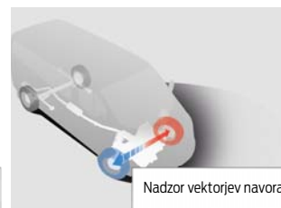
Nadzor vektorjev navora