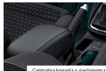
Centralna konzola z naslonom za roke