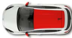
Design paket rdeča streha