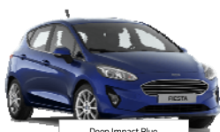
Deep Impact Blue