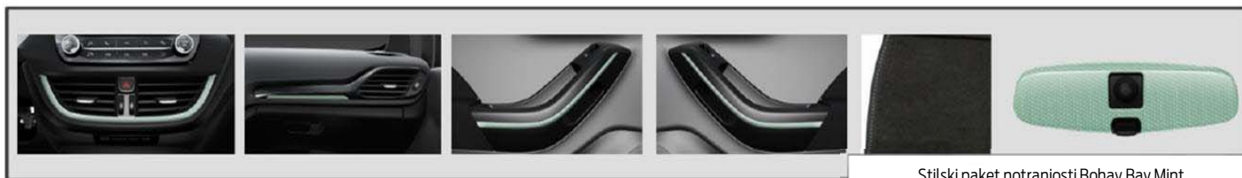
Stilski paket notranjosti Bohai Bay Mint