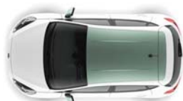
Design paket Bohai Bay Mint streha