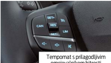
Tempomat s prilagodljivim omejevalnikom hitrosti