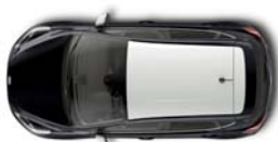
Design paket bela streha