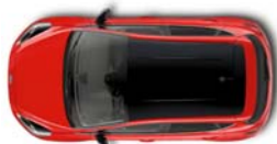
Design paket črna streha