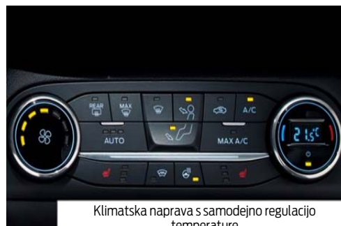
Klimatska naprava s samodejno regulacijo temperature