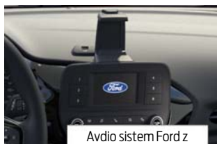
Avdio sistem Ford z MyFord Dock