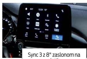
Sync 3 z 8" zaslonom na dotik