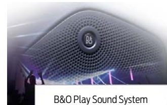
B&O Play Sound System