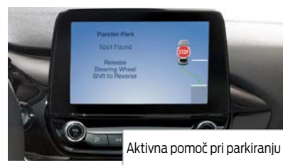
Aktivna pomoč pri parkiranju