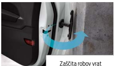
Zaščita robov vrat