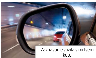
Zaznavanje vozila v mrtvem kotu