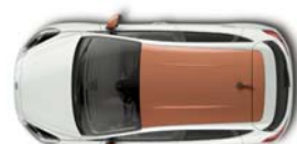
Design paket Chrome Copper