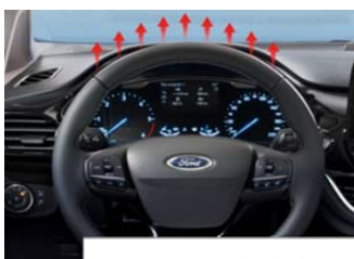
Ogrevan volanski obroč