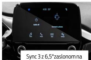
Sync 3 z 6,5" zaslonom na dotik