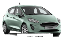
Bohai Bay Mint