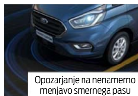
Opozarjanje na nenamerno menjavo smernega pasu