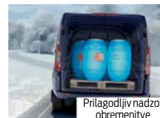
Prilagodljiv nadzor obremenitve