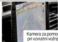
Kamera za pomoč pri vzvratni vožnji

Vključuje: prednja in zadnja tipala za pomoč pri parkiranju - v temeljni barvi, prikaz zajete slike v TFT zaslonu (7)