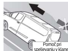
Pomoč pri speljevanju v klanec