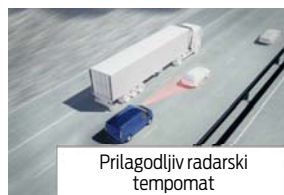
Prilagodljiv radarski tempomat

Vsebuje: sistem za opozarjanje na nezbranost voznika, samodejni vklop prednjih žarometov in zadnjih luči, samodejno preklapljanje med dolgima in zasenčenima žarometoma, prednja brisalca s tipalom za dež, tempomat z omejevalnikom hitrosti, potovalni računalnik, ogrevano vetrobransko steklo