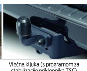
Vlečna kljuka (s programom za stabilizacijo priklopnika TSC)