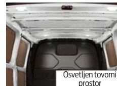
Osvetljen tovorni prostor