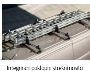
Integrirani poklopni strešni nosilci