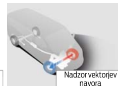
Nadzor vektorjev navora