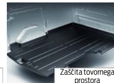
Zaščita tovornega prostora