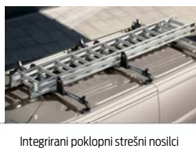
Integrirani poklopni strešni nosilci