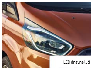
LED dnevne luči