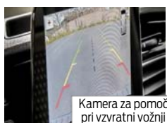
Kamera za pomoč pri vzvratni vožnji