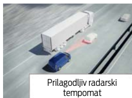
Prilagodljiv radarski tempomat