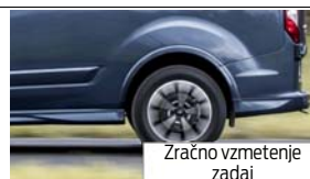
Zračno vzmetenje zadaj