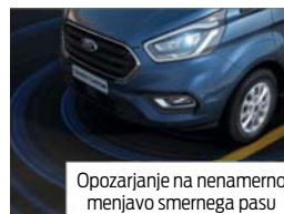
Opozarjanje na nenamerno menjavo smernega pasu