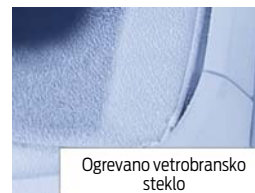
Ogrevano vetrobransko steklo