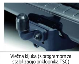
Vlečna kljuka (s programom za stabilizacijo priklopnika TSC)