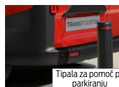
Tipala za pomoč pri parkiranju