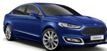
Deep Impact Blue