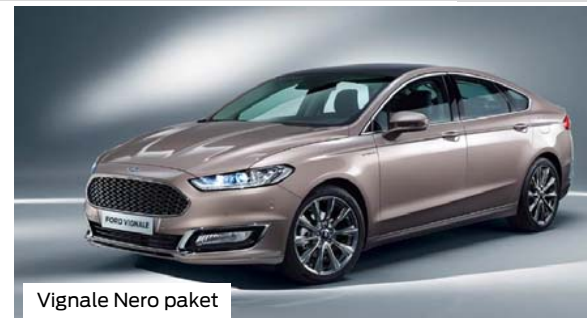
Vignale Nero paket