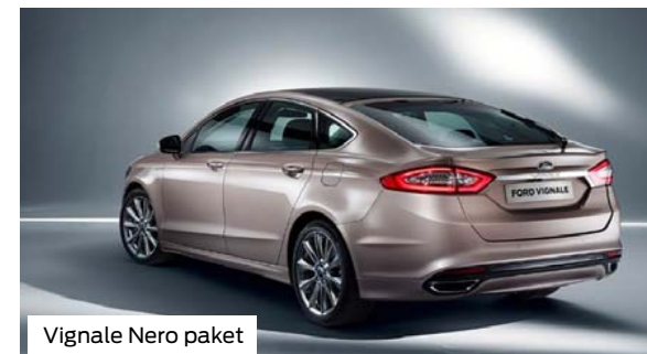
Vignale Nero paket