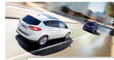
Prilagodljiv radarski tempomat

Stroški prevoza, nultege servisa in priprave vozila