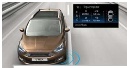
Pomoč pri ohranjanju voznega pasu