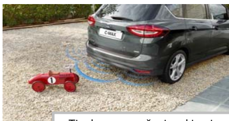
Tipala za pomoč pri parkiranju