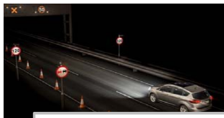
Prepoznavanje prometnih znakov