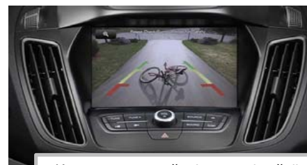
Kamera za pomoč pri vzratni vožnji