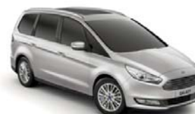
Moon dust silver