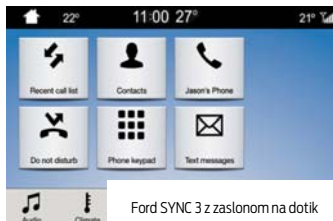
Ford SYNC 3 z zaslonom na dotik