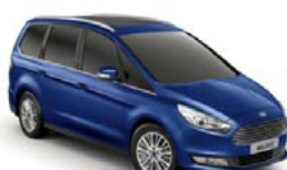
Deep Impact Blue