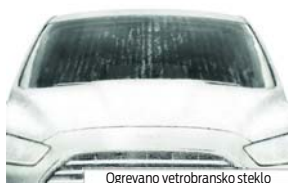
Ogrevano vetrobransko steklo