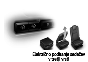
Električno podiranje sedežev v tretji vrsti