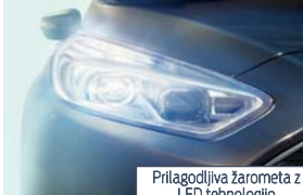
Prilagodljiva žarometna z LED tehnologijo