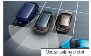
Opozorjanje na prečni promet