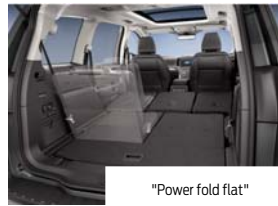
"Power fold flat"