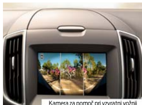
Kamera za pomoč pri vzvratni vožnji