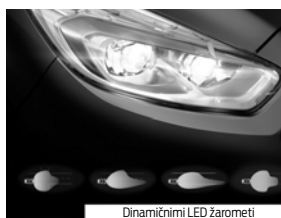
Dinamični LED žarometi