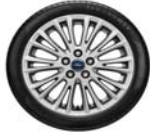
17" 10x2-kraka platišča iz lahke zlitine (Serijska oprema Titanium)