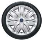
17" jeklena platišča z okras. kol. pokrovi (Serijska oprema Trend)