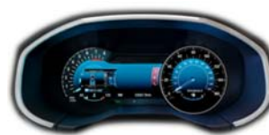
Titanium - digitalni merilniki