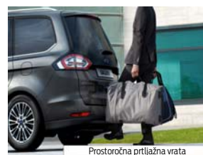
Prostoročna prtljažna vrata