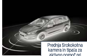
Prednja širokokotna kamera in tipala za aktivno pomoč pri parkiranju