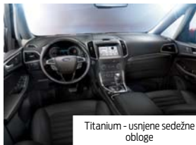
Titanium - usnjene sedežne obloge