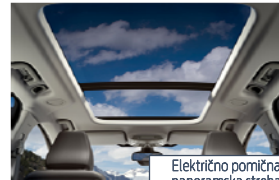
Električno pomična panoramska streha