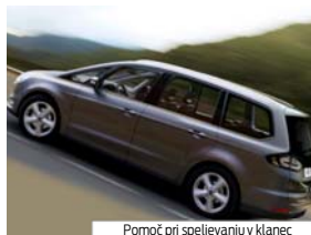
Pomoč pri speljevanju v klanec