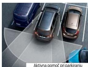
Aktivna pomoč pri parkiranju

Da bodo vaše roke prijetno tople tudi v hladnem vremenu, s pritiskom na gumb poskrbi ogrevan volanski obroč (za doplačilo v sklopu dodatne opreme).